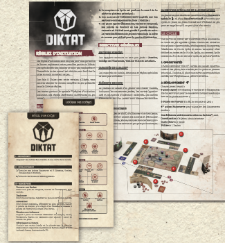
Règles d'initiation x1 Fiches Détail d'un cycle/ icônes/terminologie x5