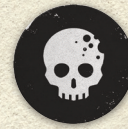
Jetons Ténèbres x6