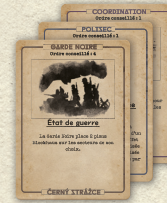
Cartes Cabale x25