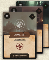
Cartes Opportunité x72