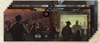
Paravents de Cabale x5