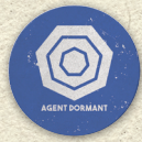
Jetons Agent Dormant x6