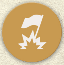
Jetons Révolte x6