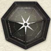
Plateau Autres x1