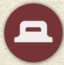
Jetons Blockhaus x6